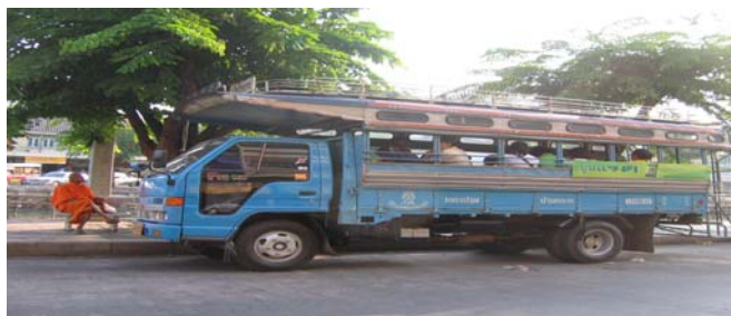
รถโดยสารบริเวณรอบตลาดบนและตลาดล่าง ของจังหวัดนครปฐม

หลังจากการทำงานครั้งแรกของการวิจัยผ่านไป กลุ่มรถโดยสารรอบตลาดบน ตลาดล่างก็ได้มีสมาชิกเพิ่มเติมอีกสองคน ซึ่งได้ทำเรื่องความพึงพอใจของผู้ใช้บริการของศูนย์สุขภาพชุมชนองค์พระปฐมเจดีย์ ที่สมาชิกใหม่ตัดสินใจเข้าร่วมตัวกับกลุ่มนี้เนื่องจากเหตุผลที่ว่า งานวิจัยเรื่องรถโดยสารนี้เป็นงานที่ค่อนข้างใหญ่ ต้องเก็บข้อมูลเป็นจำนวนมาก เพราะมีรถโดยสารหลายสาย หากมีผู้ทำงานวิจัยเพียงสองคนก็กลัวว่า จะเก็บข้อมูลไม่ทัน และอีกเหตุผลหนึ่งก็คือ มีความอยากรู้และสนใจในเรื่องของรถโดยสารเหมือนกันหลังจากที่ได้ฟังการนำเสนอของเพื่อน จึงอยากที่จะมาช่วยทำงานในการวิจัยครั้งนี้