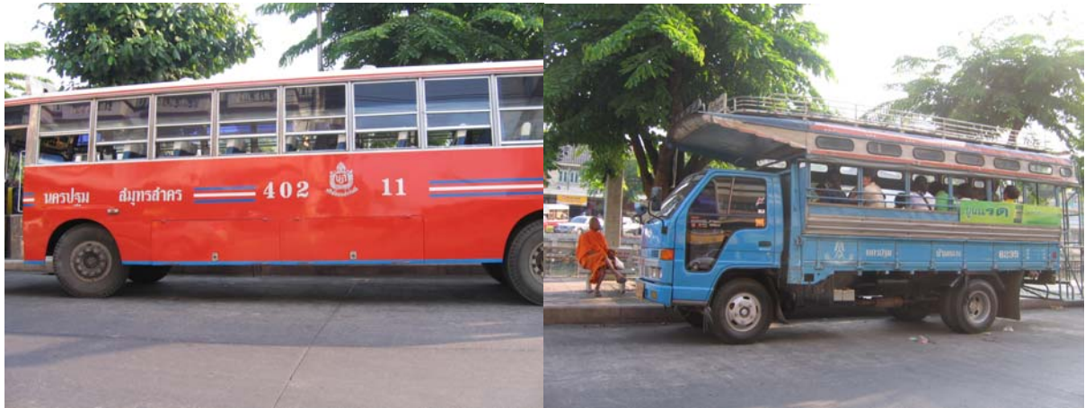
ลักษณะของรถโดยสารที่เป็นรถบัสธรรมดา และรถสองแถว ซึ่งเป็นลักษณะของรถโดยสารส่วนใหญ่ที่พบ

นอกจากนี้ลักษณะรถโดยสารยังมีผลต่อการกำหนดราคาอัตราค่าโดยสารรถปรับอากาศมีราคาเริ่มต้นแพงกว่ารถลักษณะอื่นๆ การกำหนดราคาอัตราค่าเดินทางถึงปลายทางเพียงราคาเดียว รถปรับอากาศจะจอดรับส่งผู้โดยสารเฉพาะจุดที่สำคัญๆ รถบัสธรรมดาและรถสองแถวมีการกำหนดราคาเริ่มต้นในอัตราที่ใกล้เคียงกัน ซึ่งจะเริ่มต้นที่ราคาประมาณ 5 บาท