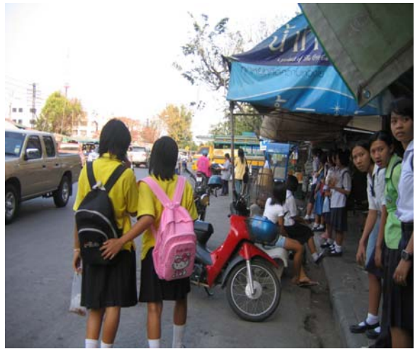
บริเวณทำรถโดยสารรอบตลาดบนและตลาดล่าง ซึ่งเป็นที่ชุมนุมมีความคึกคักของประชาชนตลอดเวลา