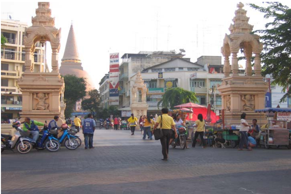
บริเวณสะพานยักษ์ ที่เป็นตำแหน่งที่ตั้งของรถโดยสารที่สำคัญหลายสาย

รถโดยสารประจำทางที่อยู่บริเวณโดยรอบตลาดบนและตลาดล่าง มีทั้งหมด 22 สาย ซึ่งทั้งนี้ไม่ได้รวมรถโดยสารของบริษัทขนส่ง มิตรภาพ จำกัด ซึ่งดำเนินการโดยธุรกิจเอกชน ตำแหน่งที่ตั้งของท่ารถโดยสารประจำทางทั้งหมดที่มีบริเวณรอบตลาดบนและตลาดล่างกลุ่มของท่ารถที่ตั้งอยู่ตลาดบนและตลาดล่าง มี 5 บริเวณ ดังนี้ บริเวณท่ารถบ้านโป่ง บริเวณสะพานเกวียน บริเวณสะพานยักษ์ บริเวณตลาดกัลยา และบริเวณท่ารถเมล์ขาว ซึ่งจุดที่สำคัญของท่ารถโดยสาร : บริเวณสะพานยักษ์ ท่ารถโดยสารประจำทางจุดบริเวณสะพานยักษ์ถือว่ามีความสำคัญอย่างมาก ซึ่งประกอบด้วยท่ารถโดยสารจำนวน 12 สาย โดยมีสายที่สำคัญได้แก่ สายกรุงเทพฯ-นครปฐม โดยความสำคัญของตำแหน่งที่ตั้งของท่ารถโดยสาร เนื่องจากบริเวณสะพานยักษ์ อยู่ใกล้กับทั้งบริเวณตลาดบนและตลาดล่าง ซึ่งสะพานยักษ์จะเชื่อมระหว่างองค์พระปฐมเจดีย์ และสถานีรถไฟนครปฐม